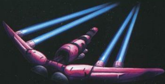
レーザートラップ